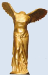
2006 拉斯克德贝基 临床医学研究奖