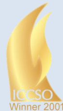
2001 国际医疗服务贡献奖