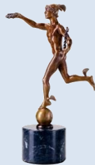
2004 国际健康与医疗奖