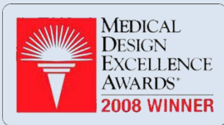
2008 最佳医疗器械产品设计奖