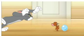
干预游戏，猫抓老鼠