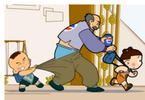
干预视频：为什么要打针